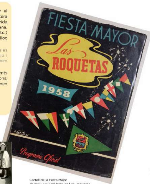
Cartell de la Festa Major de l'any 1958 del barri de Las Roquetas.