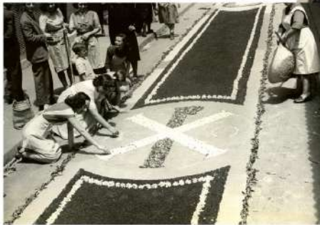
Velinas fent la catifa per a la processó de Corpus a la plaça de la Llibertat el 1951.