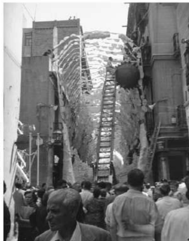
Procés de realització i vista del guarnit del Carrer Martínez de la Rosa. Any 1956.